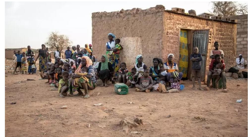
Des femmes et des enfants, déplacés internes, le 2 février 2020 à Kaya, au Burkina Faso.