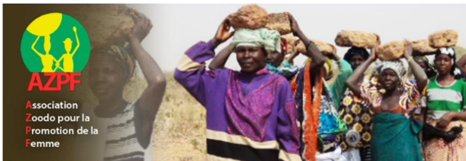
L'équipe de Zoodo renforce ses capacités en hygiène et assainissement